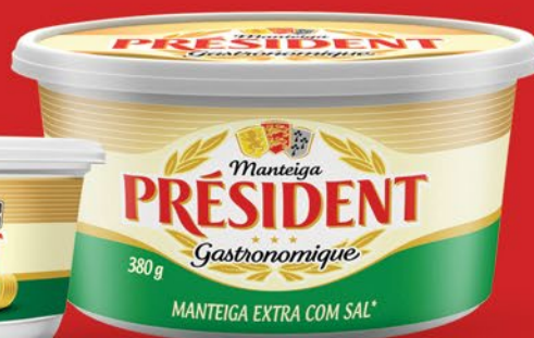
COM SAL 380g