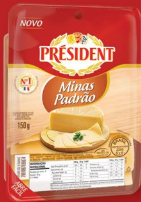
FATIADO MINAS PADRÃO 150g