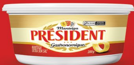
SEM SAL 200g