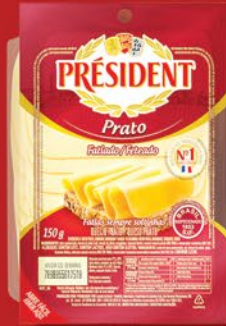
PRATO FATIADO 150g