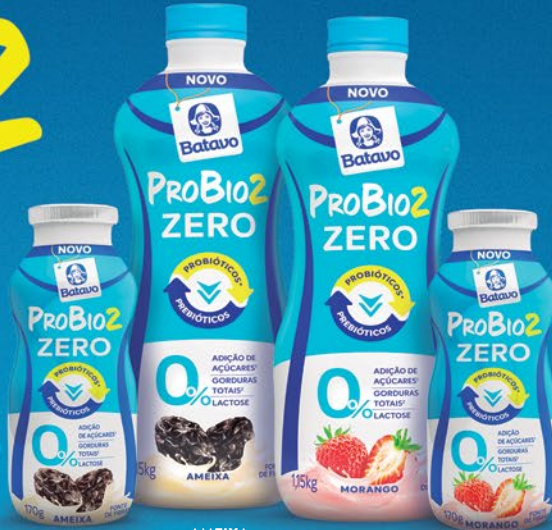
AMEIXA AMEIXA MORANGO MORANGO