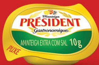
COM SAL 10g