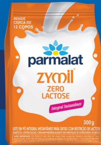
ZERO LACTOSE 300g