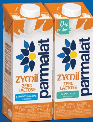
SEMIDESNATADO 1 LITRO