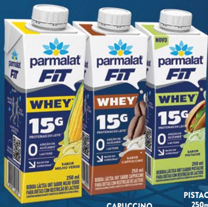
MILHO VERDE 250ml