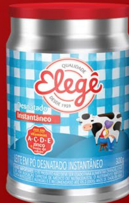
DESNATADO INSTANTÂNEO LATA 300g