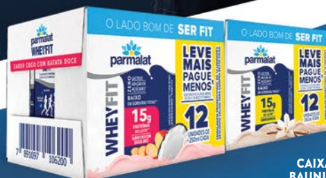
CAIXA COM 12 BAUNILHA 250ml