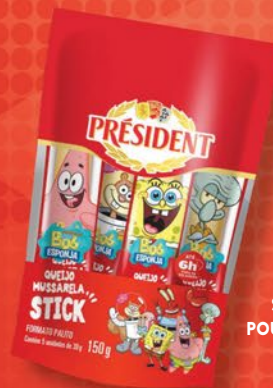
STICK POUCH 150g

SUCESSO COM CRIANÇAS, ADOLESCENTES E ADULTOS