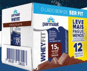
CAIXA COM 12 CHOCOLATE 250ml