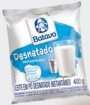
LEITE EM PÓ DESNATADO INSTANTÂNEO 400g