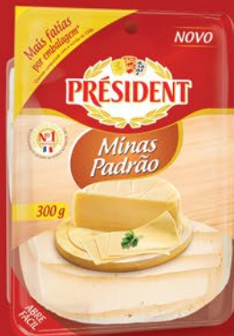
FATIADO MINAS PADRÃO 300g