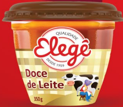
DOCE DE LEITE 350g