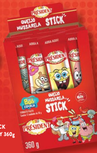
STICK DISPLAY 360g