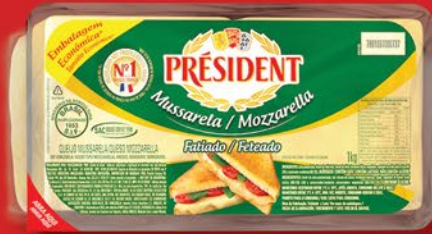
MUSSARELA FATIADO 1kg