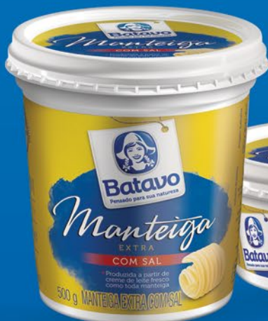
COM SAL 500g