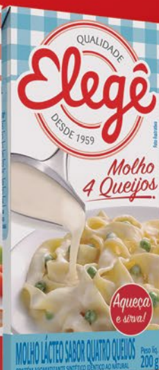
4 QUEIJOS 200g