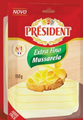
FATIADO MUSSARELA EXTRA FINO 150g