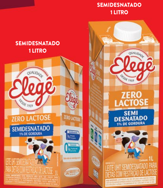
SEMIDESNATADO 1 LITRO