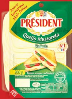
MUSSARELA FATIADO 300g