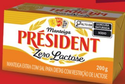
ZERO LACTOSE COM SAL 200g