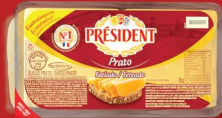
PRATO FATIADO 1kg