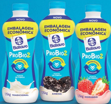
TRADICIONAL AMEIXA MORANGO