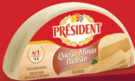
MINAS PADRÃO PESO VARIÁVEL