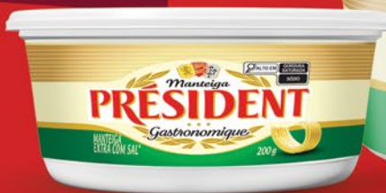
COM SAL 200g