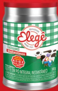
INTEGRAL INSTANTÂNEO LATA 380g