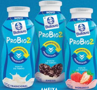
TRADICIONAL AMEIXA MORANGO