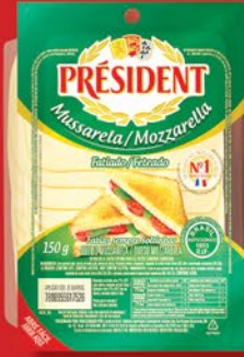
MUSSARELA FATIADO 150g