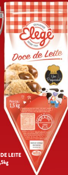
DOCE DE LEITE 1,5kg