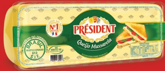
MUSSARELA PEÇA 3kg