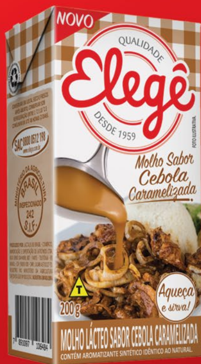
CEBOLA CARAMELIZADA 200g