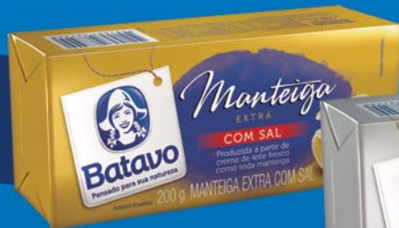
COM SAL 200g