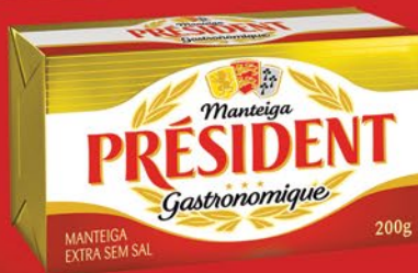
SEM SAL 200g