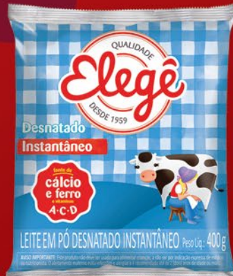
DESNATADO INSTANTÂNEO 400g