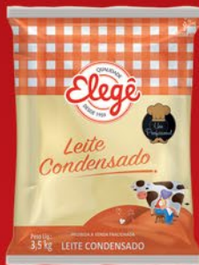
LEITE CONDENSADO 3,5kg