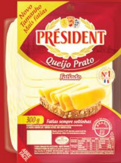
PRATO FATIADO 300g