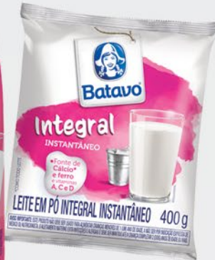
LEITE EM PÓ INTEGRAL INSTANTÂNEO 400g