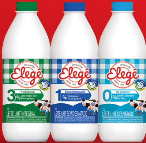
INTEGRAL 1 LITRO