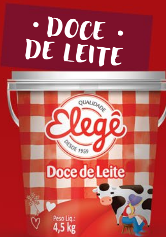
DOCE DE LEITE 4,5kg