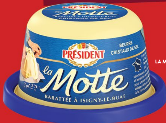
LA MOTTE 250g