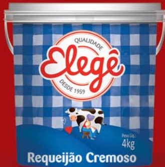
REQUEIJÃO CREMOSO 4kg