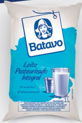
PASTEURIZADO INTEGRAL 1 LITRO