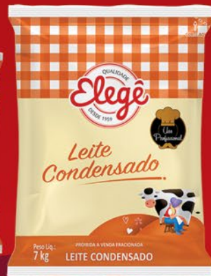
LEITE CONDENSADO 7kg