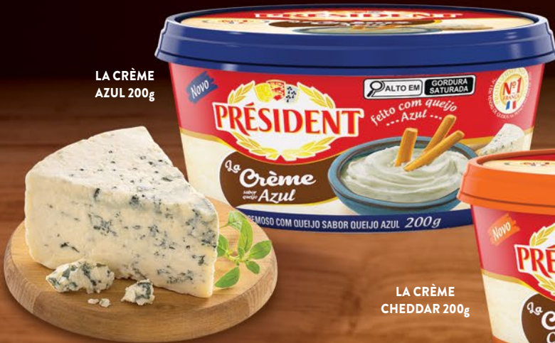
LA CRÈME CHEDDAR 200g