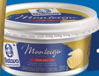
COM SAL 200g