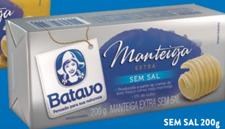
SEM SAL 200g