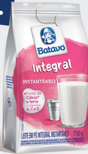
LEITE EM PÓ INTEGRAL INSTANTÂNEO 750g