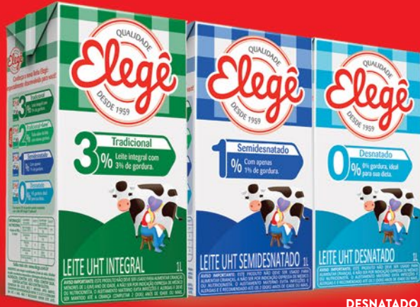
INTEGRAL 1 LITRO