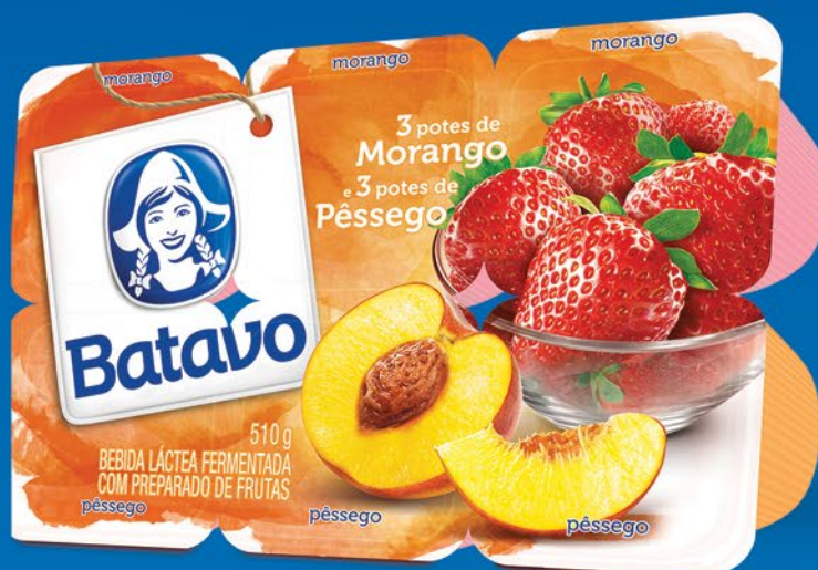
MORANGO E PÊSSEGO 510g