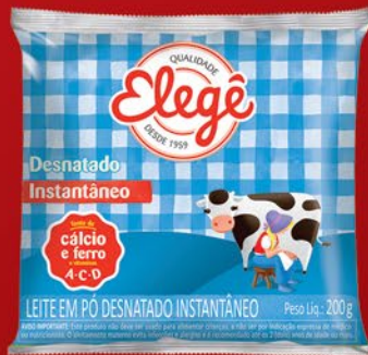
DESNATADO INSTANTÂNEO 200g