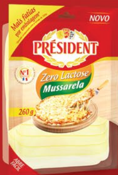
ZERO LACTOSE 260g