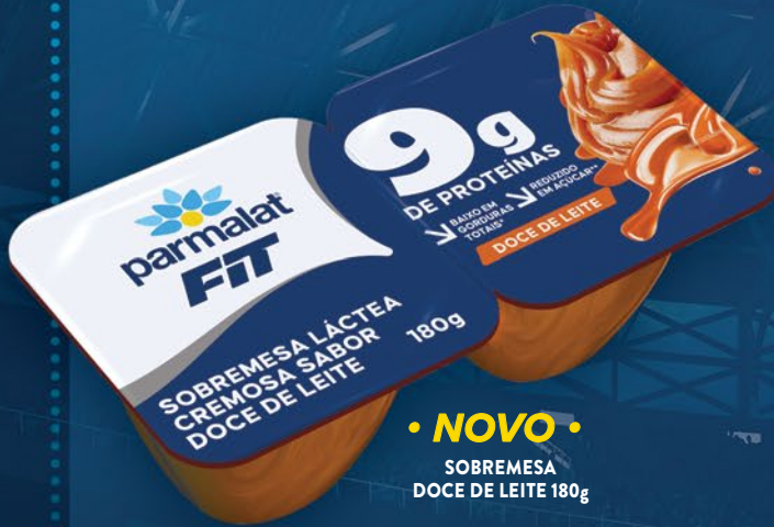
• NOVO • SOBREMESA DOCE DE LEITE 180g