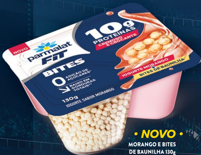
• NOVO • MORANGO E BITES DE BAUNILHA 130g