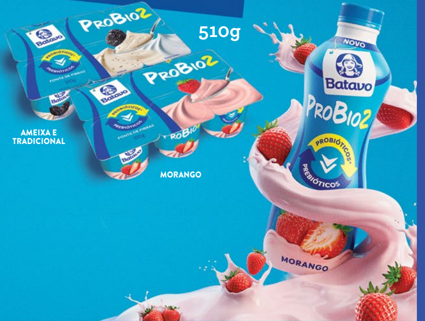
AMEIXA E TRADICIONAL MORANGO