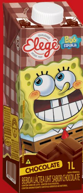
CHOCOLATE 1 LITRO