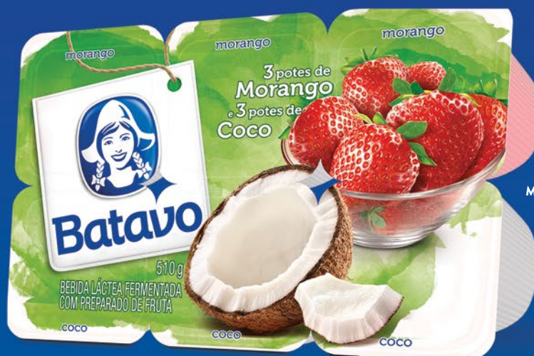
MORANGO E COCO 510g