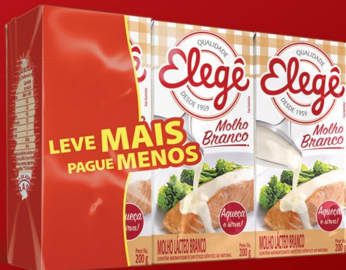
BRANCO (PACK LEVE MAIS, PAGUE MENOS) 3 x 200g