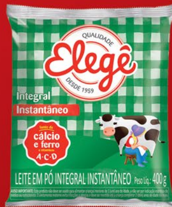
INTEGRAL INSTANTÂNEO 400g