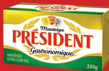
COM SAL 200g