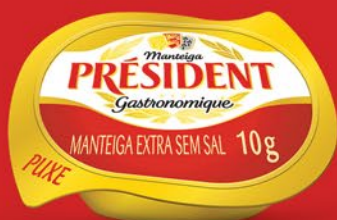
SEM SAL 10g