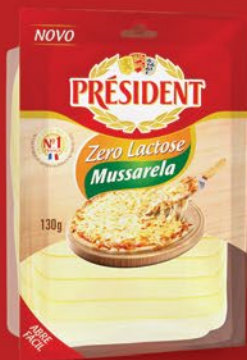
ZERO LACTOSE 130g