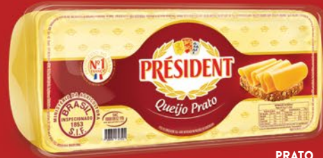
PRATO PEÇA 3kg