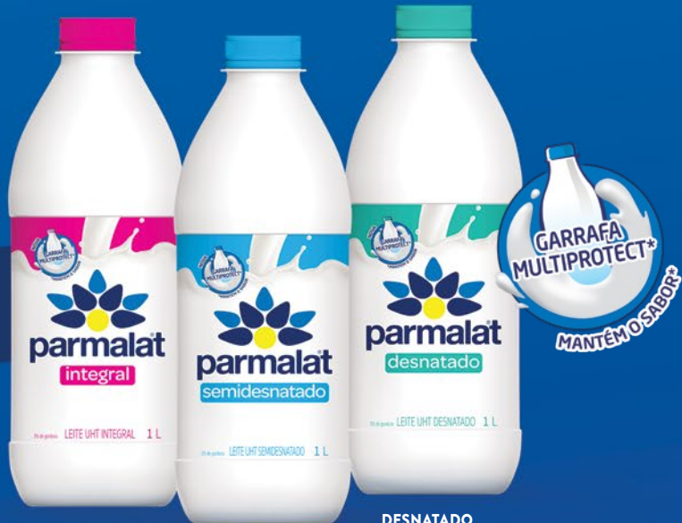
INTEGRAL 1 LITRO